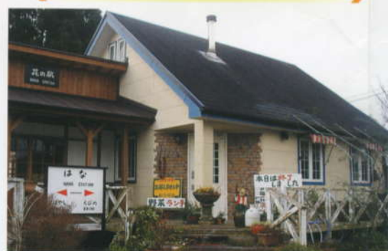
NPO法人たかはるハートム ホームページアドレス http://heartom.nobody.jp